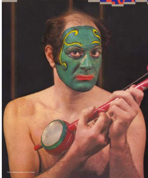
Mauricio Kagel