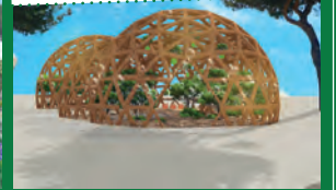
Les Jardiniers Nomades