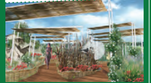
Mouvements et Paysages