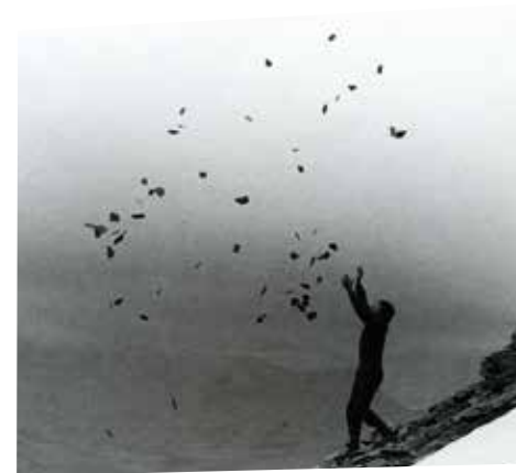
Andy Goldsworthy, Cheshire, 1956 - State Throws, Blencathra Mountain, Cumbria, 19 février 1988 - 12 photographies Cibachrome - 31 x 48 cm chaque - Collection particulière

La saison estivale du MAMAC tisse une filiation entre des pratiques contemporaines et des enjeux artistiques explorés par Yves Klein, à l'aube des années 1960, alors qu'il entreprend de saisir les « états-moments de la nature ». Dans son sillage, de nombreux artistes tenteront de convoquer les éléments et expérimenteront de possibles co-crétions avec la nature. En filigrane, l'exposition esquisse également des perspectives entre art et enjeux écologiques contemporains.