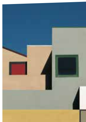
Paesaggio urbano, Venice, Los Angeles - 1990

Depuis les années 1960, Franco Fontana est considéré comme l'un des grands maîtres de la photographie couleur. Pour lui, la couleur est un sentiment philosophique, une émotion, une interprétation et un moyen de connaissance. Laisant de côté toute tentative de narration et de description, son travail vise à bousculer les habitudes mentales qui aveuglent notre regard.