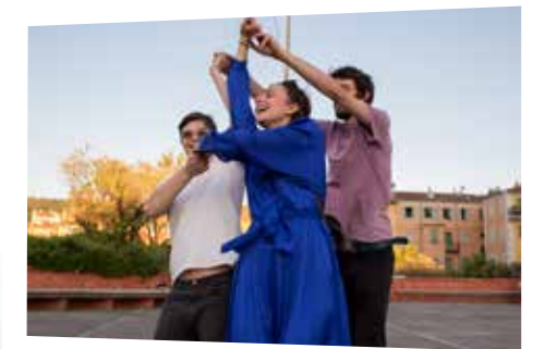
© Mathilde Dadaux, « RIEN / rendre l'histoire habitable »